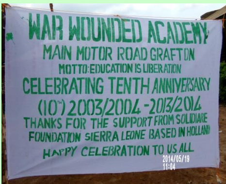
Enkele foto's van viering van het 10 jarig bestaan War Wounded Academy in Grafton.

Er zijn verschillende activiteiten georganiseerd, zoals een voetbaltoernooi en een debatwedstrijd en natuurlijk mocht een optreden van de schoolband ook niet ontbreken. Het bestuur heeft in 2013 besloten een eenmalige financiële bijdrage te sturen voor deze speciale dag. Van Sheriff hebben we begrepen dat het een geslaagd feest was. Zie de foto's. Op naar de volgende tien jaar!